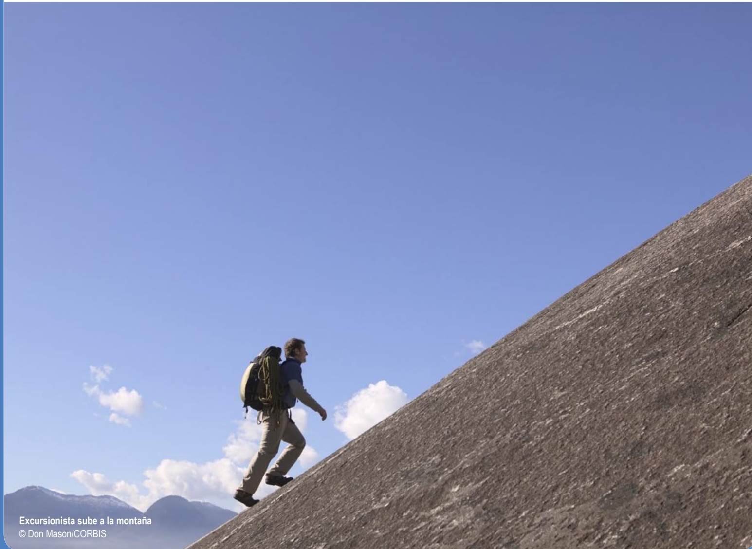
Excursionista sube a la montaña