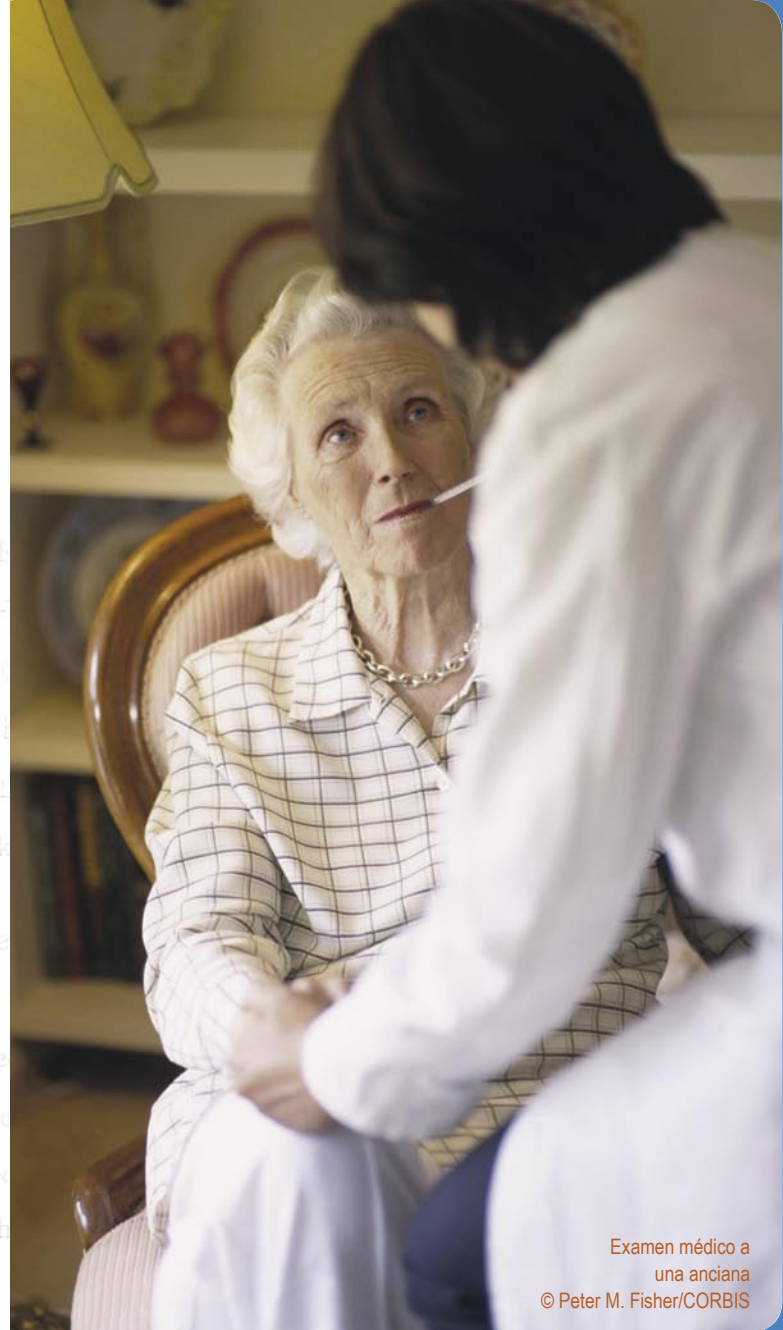
Examen médico a una anciana