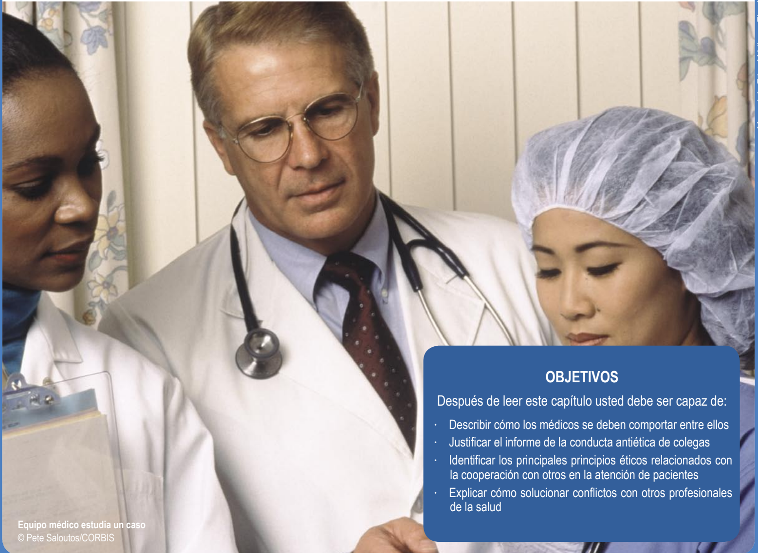
Equipo médico estudia un caso