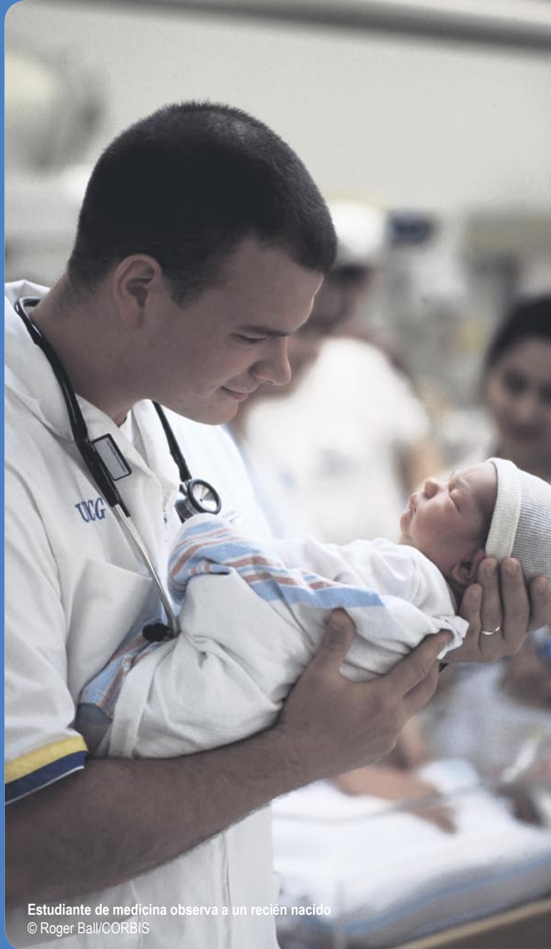
Estudiante de medicina observa a un recién nacido