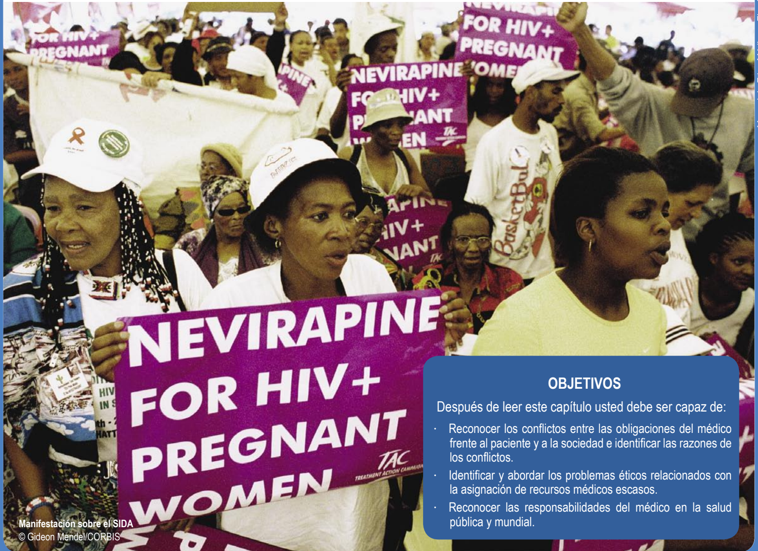
Manifestación sobre el SIDA