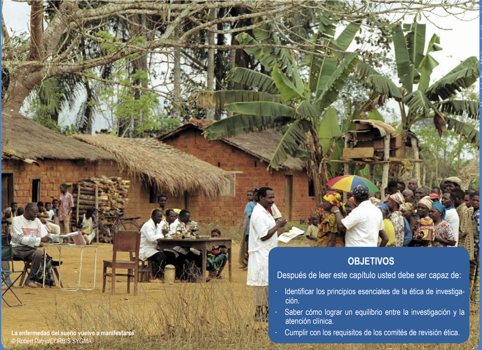
La enfermedad del sueño vuelve a manifestarse