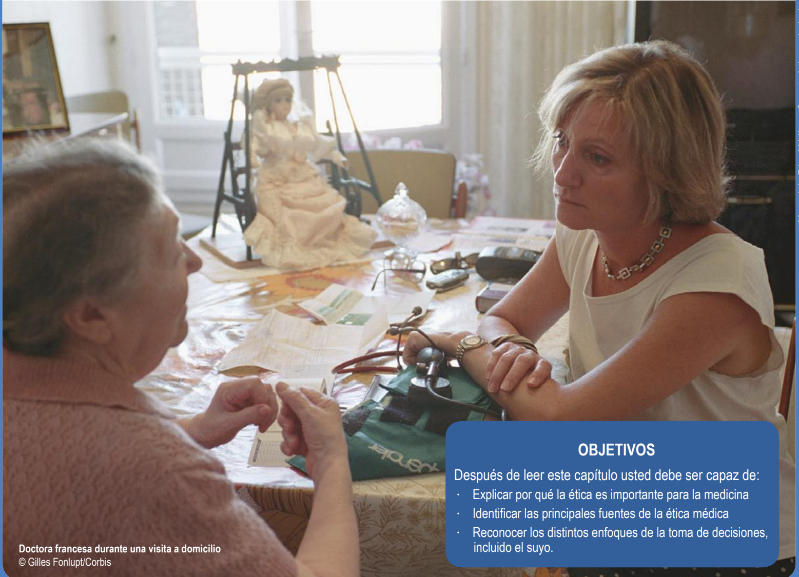
Doctora francesa durante una visita a domicilio